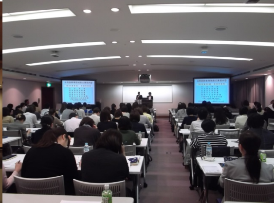
新小倉病院さんの実務報告