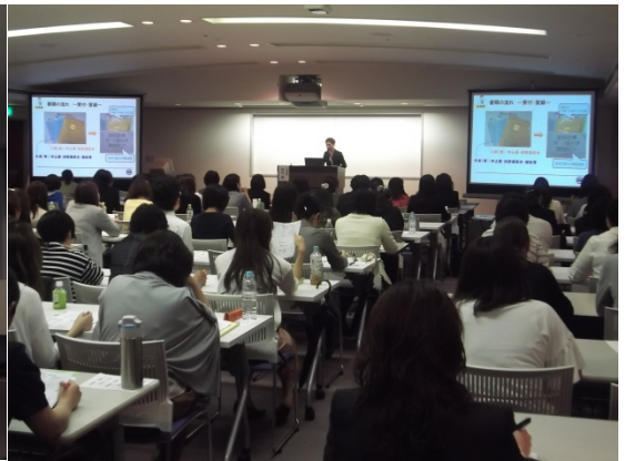
小波瀬病院さんの実務報告